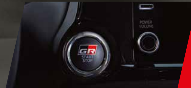
Sistema de encendido por botón con diseño Gazoo Racing