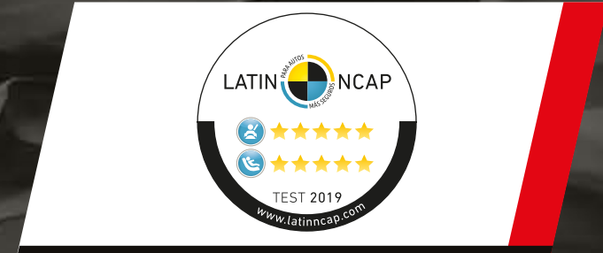
Hilux obtuvo 5 estrellas en protección para adultos y niños.