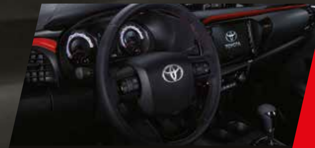
Detalles interiores y costuras color rojo