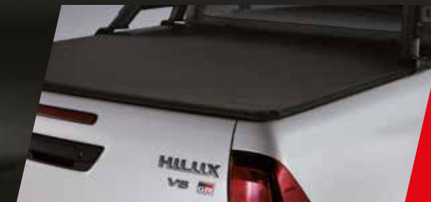
Cobertor de caja y lona