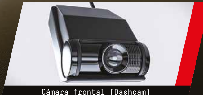
Cámara frontal (Dashcam) FullHD con GPS y WiFi