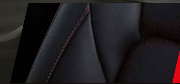
Butacas de cuero natural y ecológico con perforado rojo