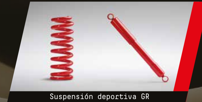
Suspensión deportiva GR