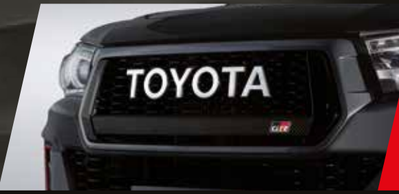
Parrilla exclusiva con emblema Toyota