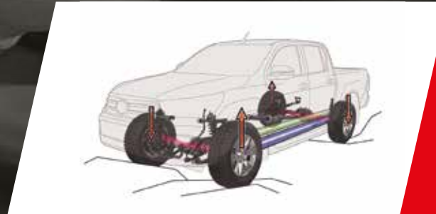
Control de tracción activo (A-TRC)