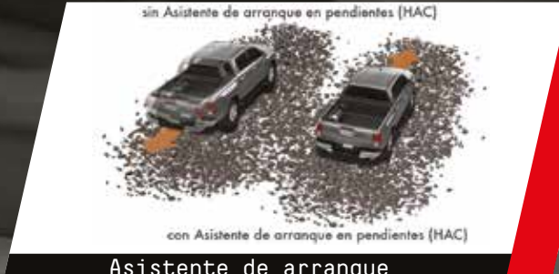
Asistente de arranque en pendientes (HAC)