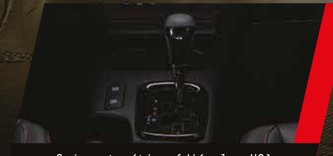
Caja automática (diésel y V6)