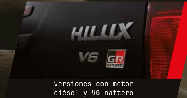
Versiones con motor diésel y V6 naftero

Con la nueva combinación del motor V6 de alta potencia sobre el chasis con suspensión deportiva GR, vas a poder sentir la emoción de manejo sobre cualquier tipo de terreno. Su Estética deportiva es también el reflejo de nuestra filosofía, la de competir y superarnos en cada momento. Por dentro vas a encontrar el confort y la tecnología necesaria para enfrentarte a cualquier obstáculo que se te presente en el camino.