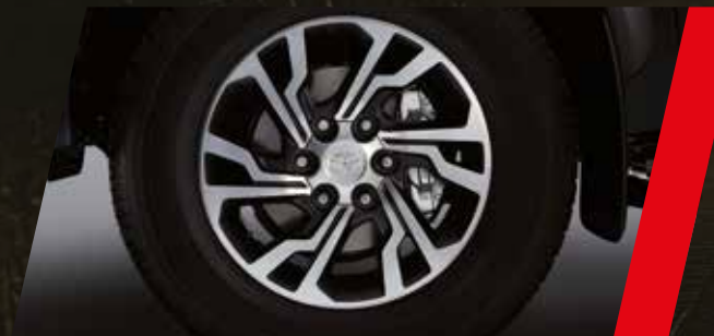
Llantas de aleación de 17"